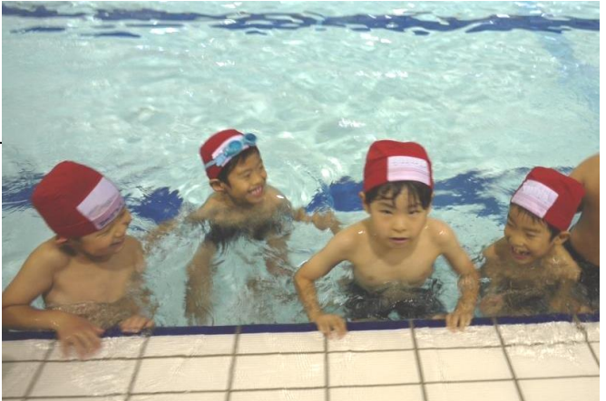
楽しみにしていた初めてのプールの授業(1年生)

泳ぐ運動」、高学年になると「水泳」と内容が変化していく。一年生では、水に慣れること