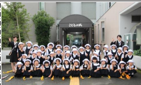
児童センター前で記念撮影

安全を第一にして帰ることができた。「家に帰ったら、お家の人と一緒に星を見た」と、興奮気味に話す児童の姿も見られた。プラネタリウムを十分に満喫した様子だった。(杉谷)