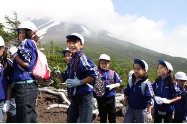
富士山を眺めながらのトレッキング