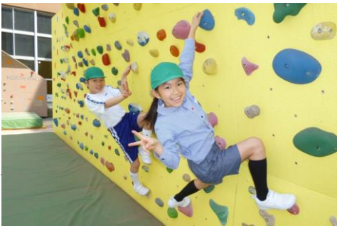
大人気の EAST WALL に挑戦

遊技を通している。また、お友達同士でダンスを発表し、表情が良くなる。その表情を大切にしたい。(山口)