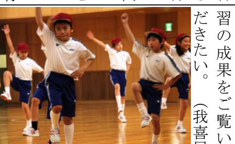
キレイのある中学年のダンス

体育の授業では、九月の体育祭で披露するダンスの練習が始まった。体育祭では一・二・三年生合同、三・四年生合同でダンスを披露し、五・六年生は合同で組体操を行う。少し恥ずかしがる子もいるが、音楽に合わせて楽しく踊っている。また、お友達同士でダンスを発表し、表情が良くなる。その表情を大切にしたい。(山口)