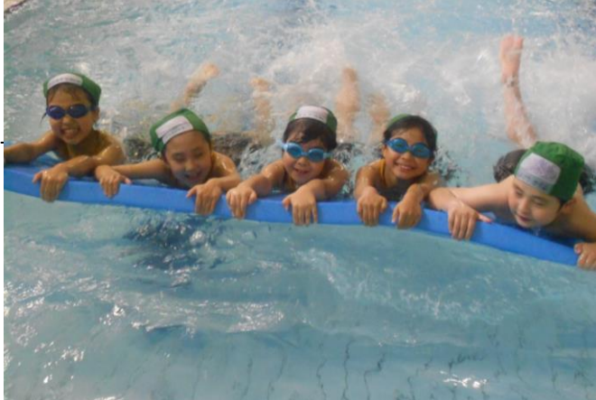
5人1組でバタ足の練習