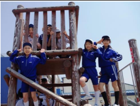
遊具場で「はい、チーズ！」

星野学園小学校は施設が充実している。児童は、休み時間には遊具場や星野ドーム、ロッククライミング等で、伸び伸びと体を動かしている。星野ドームでは、毎日のようにサッカーが行われている。クラス対抗の親善試合や、クラスごとのチーム練習... 星野学園小学校ではサッカーが盛んである。三学期には、運動委員会主催の「星野カップ」で六学年十三クラス