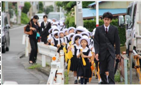
マナーを守って歩くことも大切な学習

六月二十八日(土) 川越市児童センターのこどもの城にて、一年生がプラネタリウム鑑賞を行った。学校から児童センターまでは、徒歩で向かう