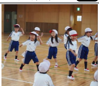
可愛らしい低学年のダンス

最後に「人生やりくりゲーム」を行った。ゲームは、マイハウスやマイカー等の購入における資金のやりくり