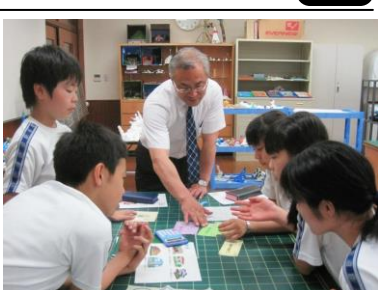
資金運用の計画を立てます。

最後に「人生やりくりゲーム」を行った。ゲームは、マイハウスやマイカー等の購入における資金のやりくり