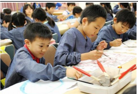
2日目の溶岩染め体験の様子

狭い洞窟を懐中電灯1つで進んでいく。子どもたちは熱心に鳴らし方を練習していた。(我喜屋)