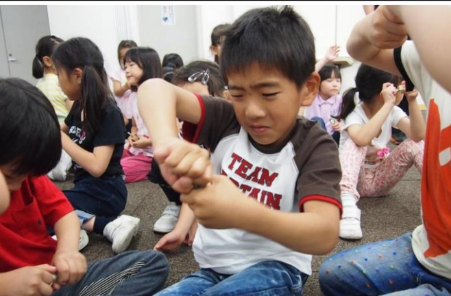
色々な音が鳴るように、ボードコールを一生懸命回す。

の仕方や入水の仕方等、一年生から細かく指導することで、限られた時間を安全かつ円滑に進めている。今後も、この恵まれた環境を活かして、水に親しみ、プールの授業を楽しんで欲しい。(我喜屋)