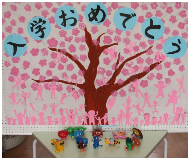
エントランスには在校生が作った桜がお出迎え

今年の春は気温の上昇が早く、桜の満開が全国的にも早かった。入学式を迎えるころには桜が散ってしまうのではないかと心配されたが、入学式前に気温が急激に下降。桜の花びらは奇跡的に満開をたもったのである。まるで新入生を歓迎するかのように咲き誇る桜は、入学式を彩った。