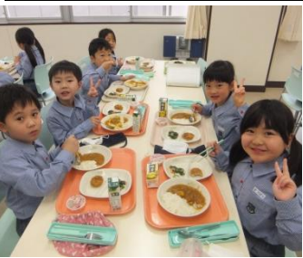
おいしい給食に笑顔がこぼれる

が、入学の喜びとともに、これかと不安で胸がいつぱら始まる星野学園でのむような歌声で、星野学校生活へドーム全体に大きく響き渡る。新入生は在校生の優しい歓迎の心に触れ、これから始まる小学校生活の不安が和らいだのではないだろうか。