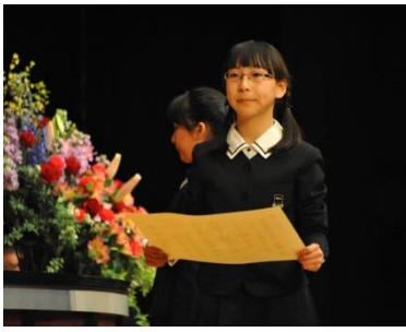
凛々しい顔立ちの卒業生

卒業証書を受け取る姿は凛々しく、まさしく最高学年としての自覚と誇りに満ち溢れた顔つきであった。送辞では六年生へこれまでの感謝の想いを綴り、答辞では母校への愛と感謝を感じさせる温かい言葉に、卒業生だけでなく、会場内全体が涙を流すことができた。卒業生にとつて小学校で歌うことが最後となる「学園歌」。それに続けて「仰げば尊し」に想いをのせて歌う。そして卒業生退場の際には、ウインドオーケストラ部