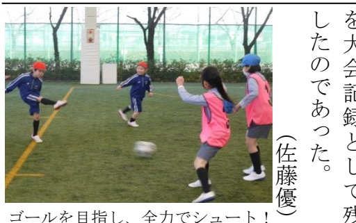
ゴールを目指し、全力でシュート!

平成二十六年(2014)度三学期、一年に一度のサッカー大会「星野カッパ」が、全校を挙げて開催された。全学年・全クラス対抗で行われ、一学年から六年生までが、分け隔てなく熱き戦いを繰り広げる。グループリーグとなる予選ブロックを戦い、ブロックごとに上位クラスが決勝トーナメントへと駒を進めることができる。勿論、学年差があり、全学年・全クラスが対等に戦えるよう、異学年での戦いはハンデ戦となる。そして、激闘を戦い抜き、栄冠を手にしたのは、六年A組であった。今大会、六年A組は、最多得点・無失点を大会記録として残したのであった。