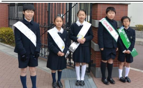
立候補者たちの毎日の挨拶が元気をくれる

給食のメニューでは特にカレーが大人気です。かわりに長蛇の列ができる。これを勉強し、心も体も大きく成長するであろう一年生の活躍が楽しみだ。