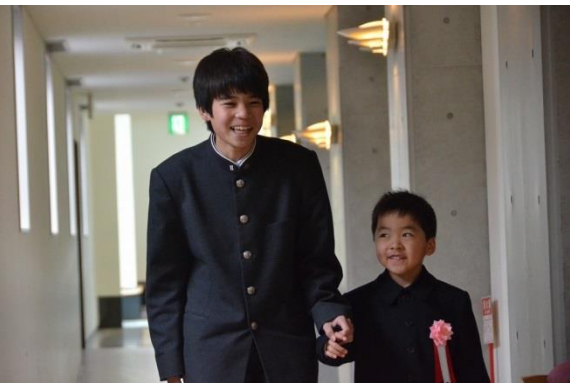
中学生と一緒に、ハーモニーホールへ

四月九日(木)に、講堂大講堂(ハーモニーホール)で挙行された。入学式には、中高の教職員だけでなく、小学四年生以上の在校生、中学生や高校生も参列し、六十三名の新一年生を温かく歓迎していた。真新しい制服に身を包んだ、初々しい一