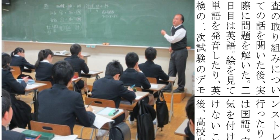
緊張した面持ちで問題に取り組みます

度からはバス利用におけるマナーについて学び、日々の通学を振り返った。どの教室においても、イラストは勿論、こり得る暴力等の非行について学んだ。携帯電話マナー教室では、真剣且つ楽しく学べる工夫を凝らした。二年生は総合的な学習の時間や普段の授業で学んだ日本の文化を紹介し、四年生は東海道上野原毛をユニークな演出でアレンジし表現した。