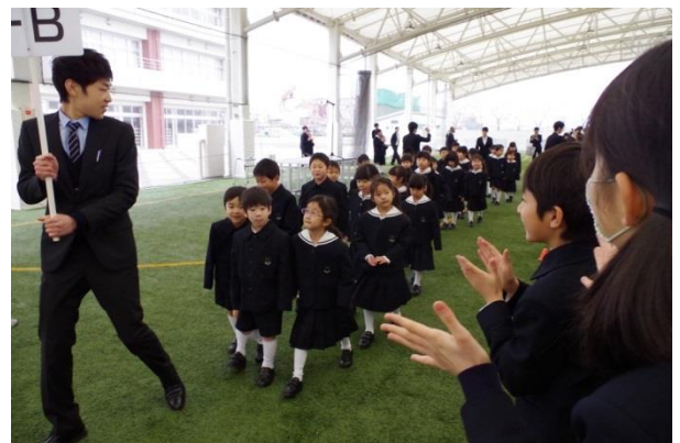
緊張しながらもしっかり列になって歩けたね

式典後、新一年生は、新しい教室で、新しいお友達や先生と学級開きを行い、小学校生活をスタートさせた。廊下や教室の各所には、入学を祝う装飾で彩られ、学校全体が新一年生を歓迎していた。