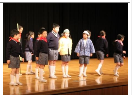
登場人物になりきって演じた4年生

二月二十一日(土)、星野記念講堂ハーモニーホールで、一年間の学習の成果を発表する学習発表会が行われた。一年生はリズムに乗せて音読するチャンツを、二年生は国語で学んだ内容を題材とした劇を披露した。三年生は総合的な学習の時間や普段の授業で学んだ日本の文化を紹介し、四年生は東海道上野原毛をユニークな演出でアレンジし表現した。