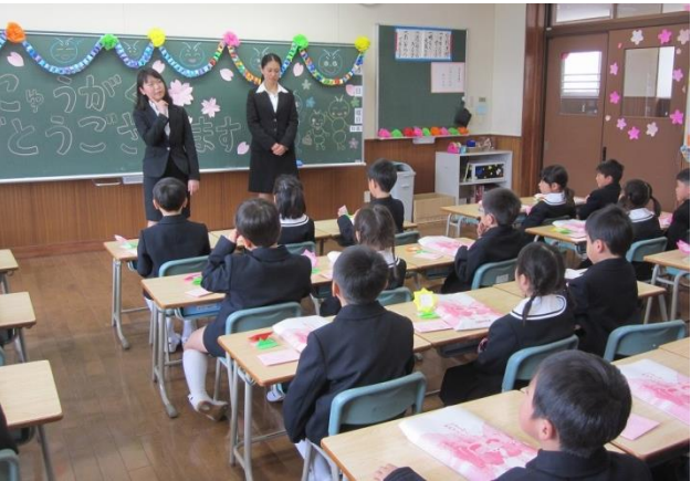
新しいクラスで、新しいお友達や先生とスタート!

四月九日(木)に、講堂大講堂(ハーモニーホール)で挙行された。入学式には、中高の教職員だけでなく、小学四年生以上の在校生、中学生や高校生も参列し、六十三名の新一年生を温かく歓迎していた。真新しい制服に身を包んだ、初々しい一