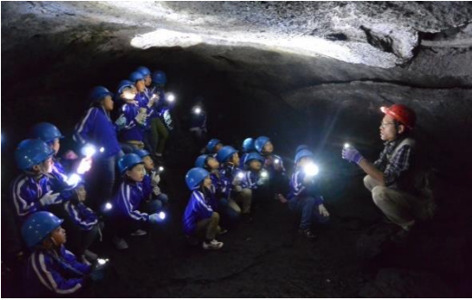
富士山の洞窟の中は真っ暗! (2年生)

六月十四日(金)・十トレッキング、二日目探検である。洞窟探検は暗く狭い道が広がる洞窟内を、懐中電灯の明かりを頼りに歩を進めて間だが、親元を離れたこの山は日本昔話の力に真つ暗闇な世界が広がった。また、一人一人の植物をまとも、素早くフォアを準備し、自然とコミュニケーションをとることができてい