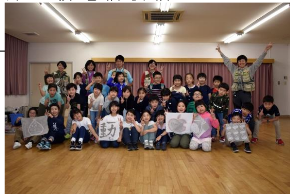
みんなで作った溶岩染め (3年生)