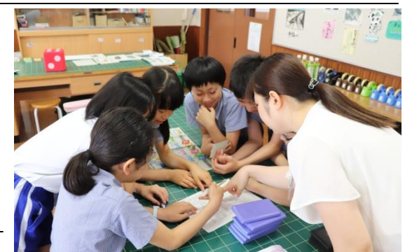
いかに手持ちの資金を増やすか、一緒に考えました