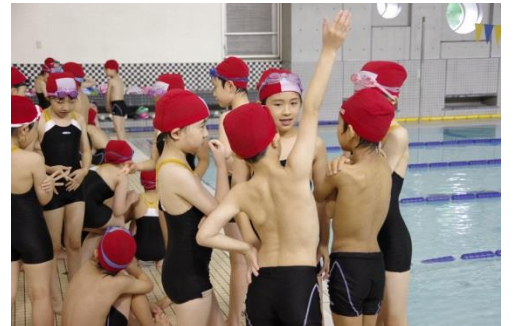
チームでの作戦会議(3年生)