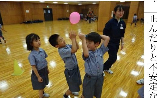
高校生との交流会