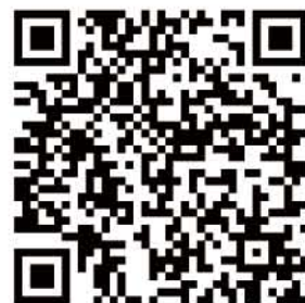
QRコード (本校の情報をご覧になれます)

注) 注意事項 オープンスクールの参加申し込みは、 5/13(日)第1回学校説明会にて 承ります。(それ以降の申し込み方 法に関しては、本校ウェブサイト に順次掲載予定です)